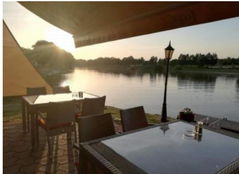
Vízfogó panzió és étterem Baja